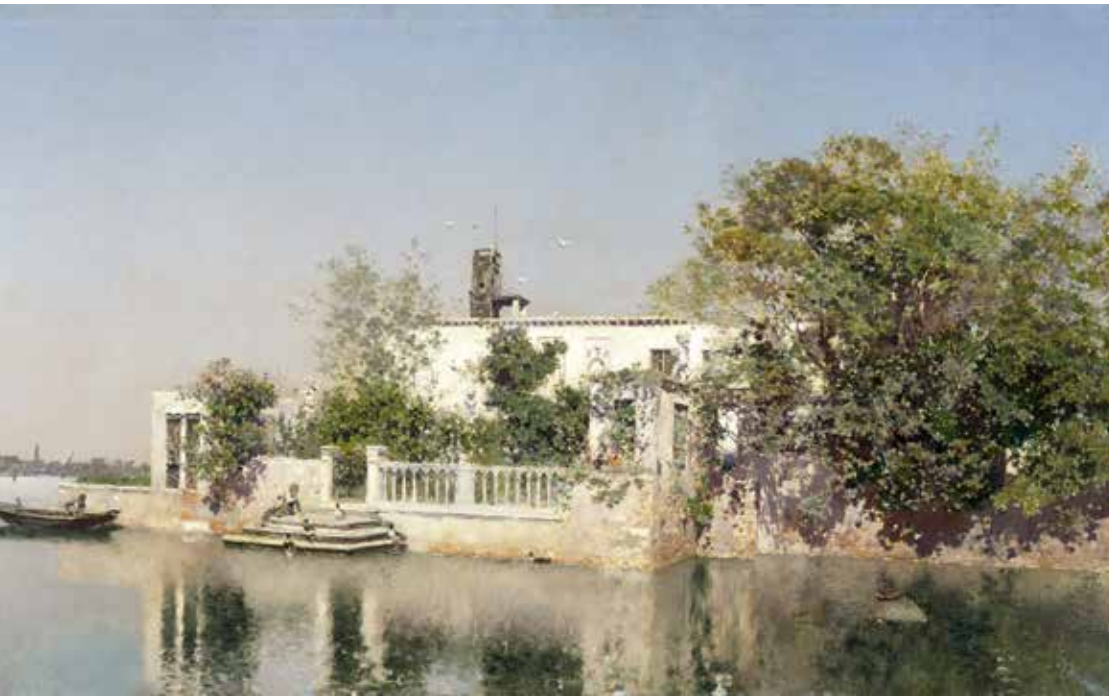
Martín Rico Ortega. Paisatge venecià. Paisaje veneciano Museo de Bellas Artes de València