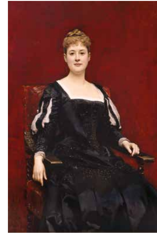
Raimundo de Madrazo y Garreta Retrat de senyora vestida de negre Retrato de señora vestida de negro Museu de Belles Arts de València