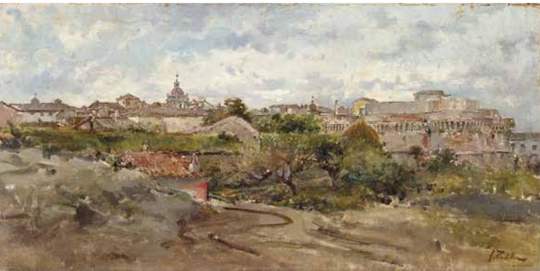
Francisco Pradilla Ortiz. Paisatge urbà. Paisaje urbano Museu de Belles Arts de València

Es artistes sempre plantegen en les seues obres una forma de veritat. Encara que tota imatge és una ficció, el que sembla fals està renyit amb la creació. Cada època construeix les seues pròpies mentides per a carregar-se de raons, igual que cada persona ho fa per a justificar-se davant els altres. A mitjan segle XIX, la fantasia, el capritx o l'ideal dels romàntics van començar a percebre's com a qualitats anacròniques. El terme veritat es va reivindicar llavors, enfront del repertori de convencions que s'ensenyaven en les acadèmies. Les seues conseqüències es detecten en diferents direccions al llarg de la segona meitat de segle, sempre sobre un substrat encara tradicional. El que havia semblat bo va començar a qüestionar-se. És un mecanisme que cada generació empra per a reafirmar-se enfront de l'anterior.