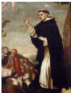
Alonso Cano: Predicació de sant Vicent Ferrer