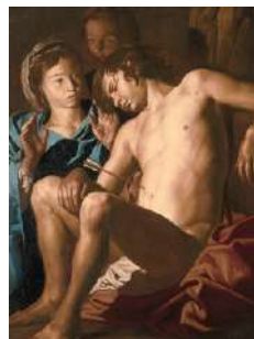
Matthias Stom: Sant Sebastià atès per santa Irene i una criada