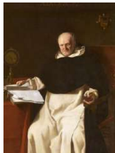
Jerónimo Jacinto de Espinosa: El pare Jerónimo Mos