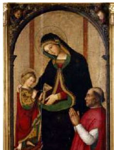
Bernardino di Benedetto di Biagio, "Il Pinturicchio": Mare de Déu de les Febres