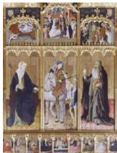
Gonçal Peris: Retaula de sant Martí amb santa Úrsula i sant Antoni Abat