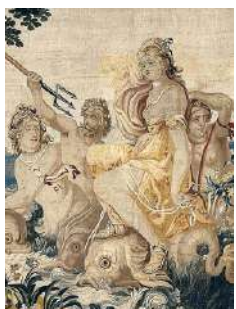
Albert Auerck: Posidó i Anfítrite