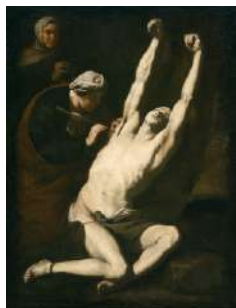
Josep de Ribera: Sant Sebastià atès per santa Irene i una criada