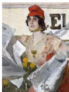
Joaquín Sorolla: Esbós de cartell per al diari El Pueblo