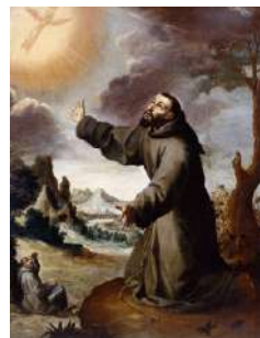
Bartolomé Esteban Murillo: Sant Francesc d'Assís