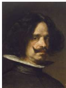
Diego Velázquez: Autoretrat