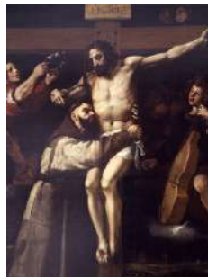
Francisco Ribalta: Abrçada de sant Francesc d'Assís al Crucificat