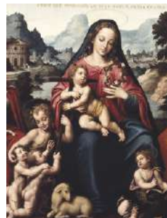
Joan de Joanes: Mare de Déu del venerable Agnesi