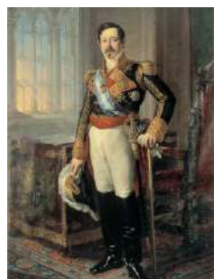
Vicente López: Retrat del capità general Ramón Narváez