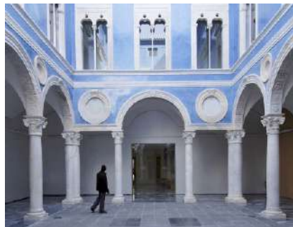
PATI VICH (ca. 1525)