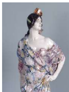
Mariano Benlliure: "Chula"