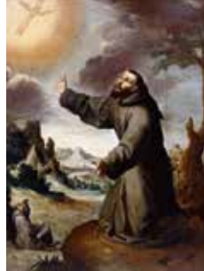
Bartolomé Esteban Murillo: San Francisco de Asís