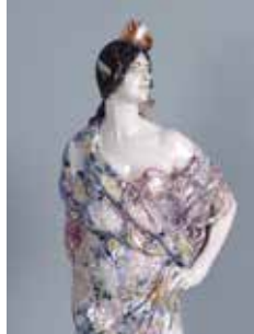
Mariano Benlliure: Chula