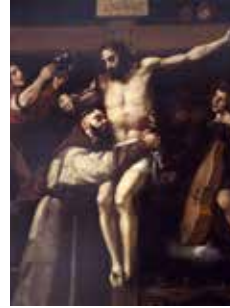
Francisco Ribalta: Abraza de san Francisco de Asís al Crucificado