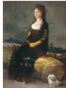
Francisco de Goya: Retrato de Joaquina Candado