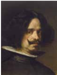
Diego Velázquez: Autorretrato