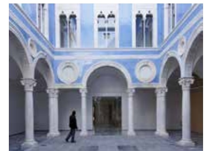
Patio Vich (ca. 1525)