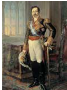
Vicente López: Retrato del capitán general Ramón Narváez