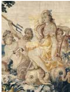
Albert Auerck: Poseidón y Anfítrite