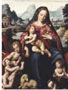
Joan de Joanes: Virgen del venerable Agnesio