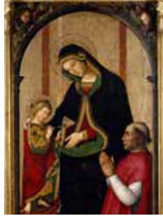
Bernardino di Benedetto di Biagio, "Il Pinturicchio": Virgen de las Fiebras