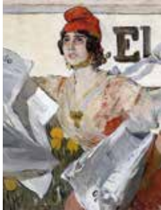
Joaquín Sorolla: Boceto de cartel para el diario El Pueblo