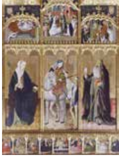
Gonçal Peris: Retablo de san Martín con santa Úrsula y san Antonio Abad