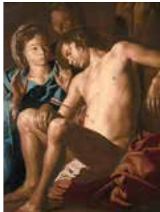
Matthias Stom: San Sebastián atendido por santa Irene y una criada