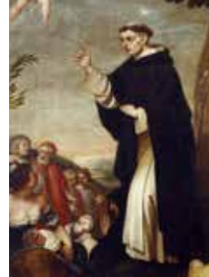
Alonso Cano: Predicación de san Vicente Ferrer