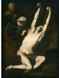
José de Ribera: San Sebastián atendido por santa Irene y una criada